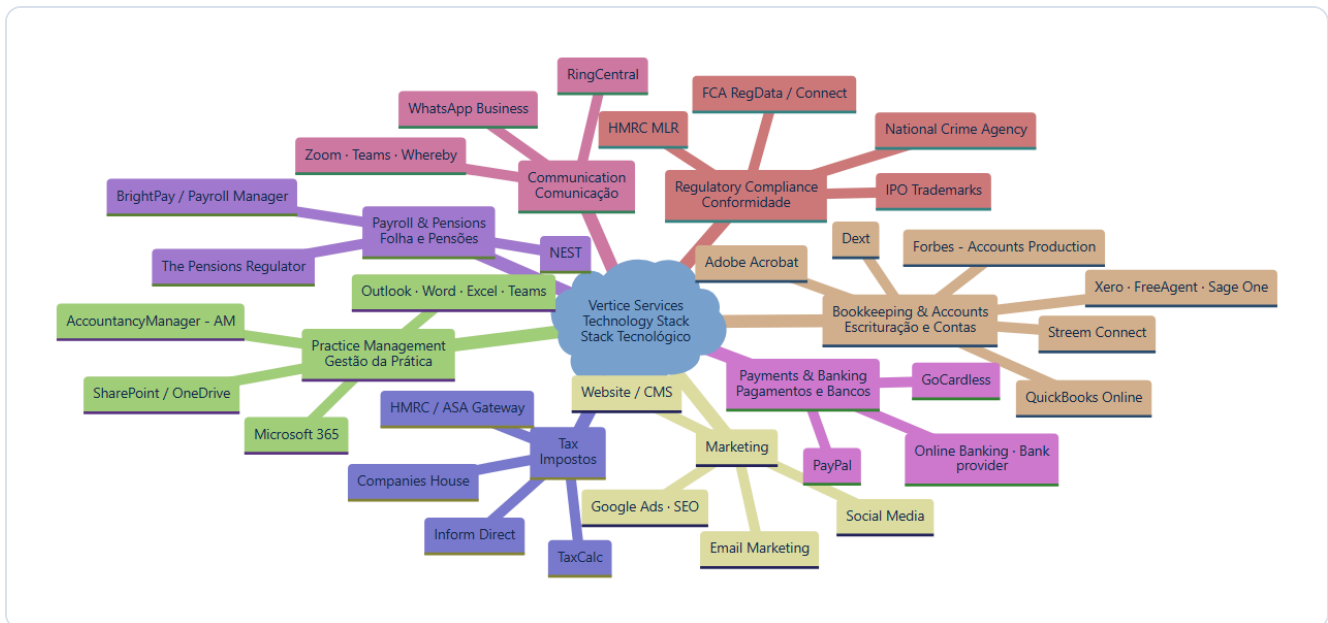
Figura 1 — Stack tecnológico por categoria · Figure 1 — Technology stack by category.

PT Visão geral de todas as ferramentas usadas pela Vertice, agrupadas por categoria funcional. EN Overview of every tool used by Vertice, grouped by functional category.